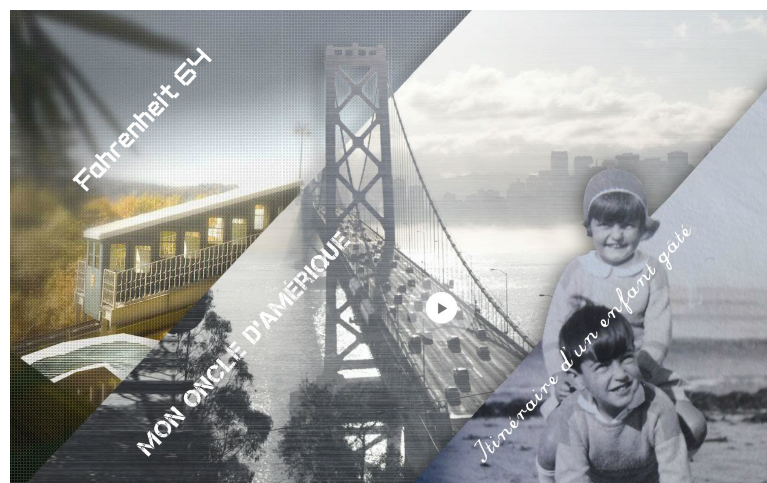
Capture d'écran de la page d'accueil de l'application ADoc

ADoc sur tablettes dispose d'un outil permettant de quantifier le nombre de lectures des différents scénarios. L'outil étant autonome, il est plus difficile de collecter les avis des utilisateurs. Cependant, le retour du public lors de présentation aux Archives a été très positif.